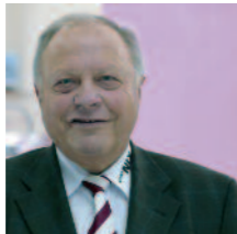
Alexander Nix Geschäftsführer